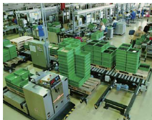
工場での連携・進捗管理