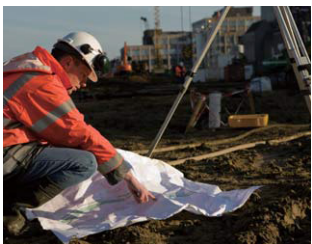
建設・工事現場での業務連絡