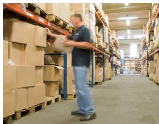
倉庫での配送指示