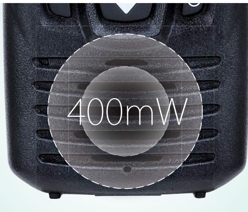
屋外や騒音下でもクリアな音声を伝える 400mW大音量スピーカー