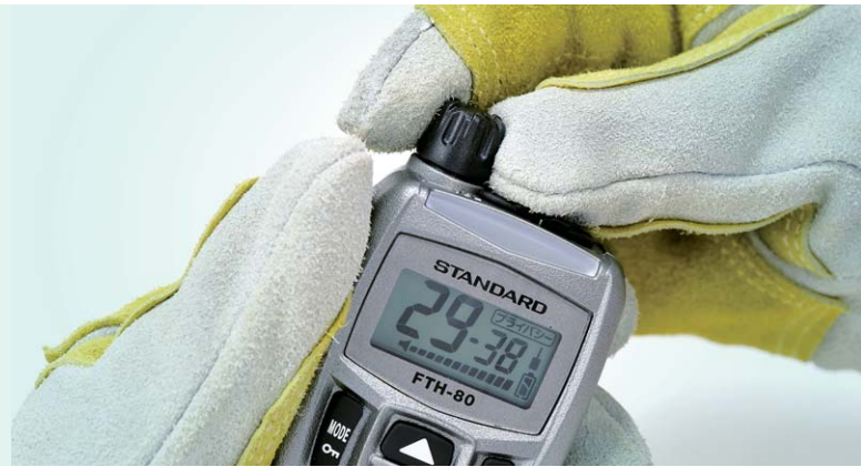
送受信の状態がひと目でわかる大型LEDインジケータ 大型ディスプレイは、チャンネルや音量を常に表示