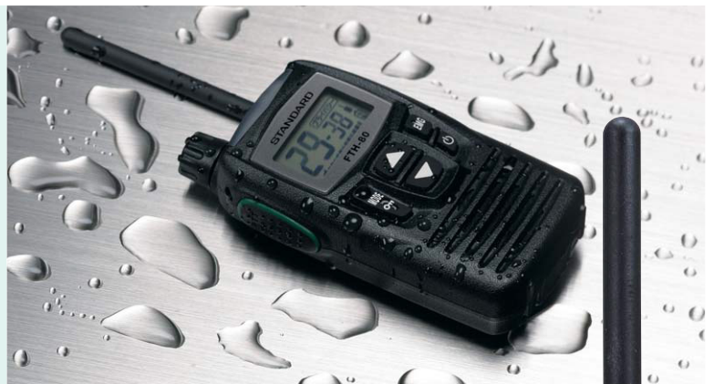
水を扱う現場や突然の雨にも対応する ワンランク上の防水性(IPX5)