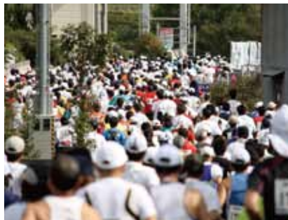
マラソン大会や祭りなど、喧騒につつまれた催事にもびったり。

周囲の雑音を打ち消すデジタル方式のノイズキャンセリング機能を搭載。騒音が気になる場所でもクリアな音声を伝え、スムーズなコミュニケーションを支援します。