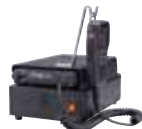
FP-33 指令局用直流安定化電源 卓上型として使用する場合は 電源装置。 大型スピーカー内蔵