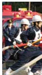
水を扱うハードな作 スムーズな連絡を