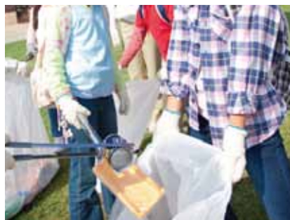
手袋着用でも連絡はラクラク。