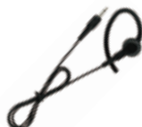
ME101/100CM イヤホンアダプタ EA-581用イヤホン EA-581に接続。 ケーブル長100cm