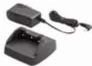
VAC-50A*1 急速充電器 標準型電池パックを約160分で充電