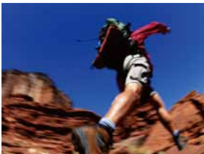
グループに分かれハイキングや トレッキングを楽しむ時も。