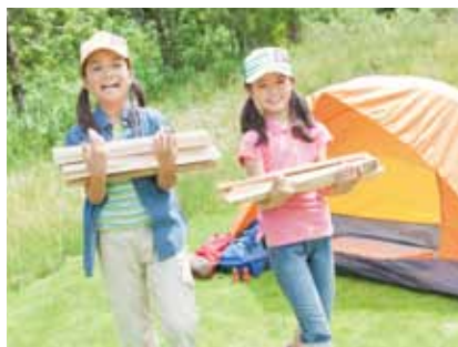
誰もが使いやすいから、 家族でのキャンプなどでも活躍。