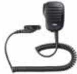
MH-83A7A スピーカーマイク しっかりとしたホールド感 3.5Φイヤホンジャック付 本体価格7,500円(税抜)