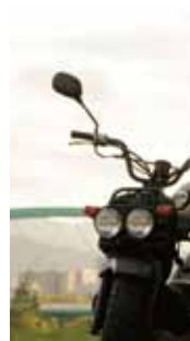
すぐに応答できない場 停車後にチェック。