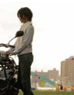
場合、リピート再生で内容を