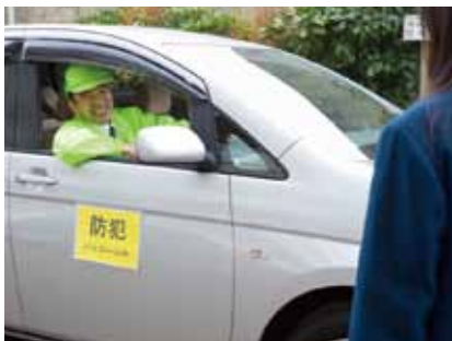
地域の安全を守るパトロールで、 相互連絡を快適に。