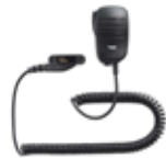
MH-82A7A コンパクトスピーカーマイク 小型で自然な装着感 3.5Φイヤホンジャック付 本体価格6,500円(税抜)