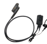
EK-505W タイピンマイク&イヤホン 手袋装着でも操作しやすい