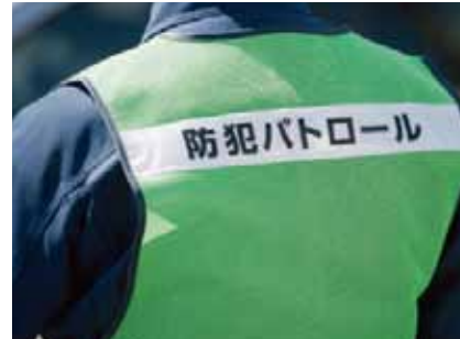
頻繁な通話や長時間の活動にも安心。