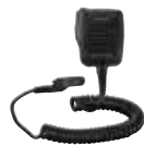
MH-66A7A 防水スピーカーマイク 防浸構造 3.5Φイヤホンジャック付