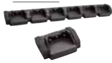
CD-51*1 連結型充電器 最大6台までの連結に対応