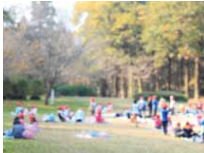
遠足などアウトドアでの長時間にわたる活動にも最適。