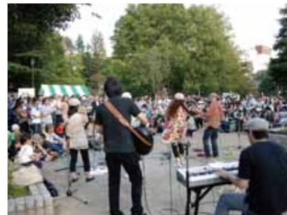
ダイナミックなサウンドや歓声の中でも通話はイキイキ。