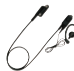
EK-313-581 小型タイピンマイク&イヤホン イヤホンは脱落防止の耳かけ式