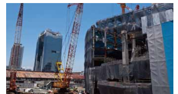
建設現場の作業連絡