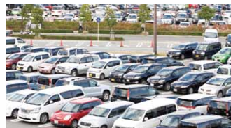
大型駐車場での誘導