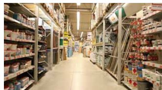
物流センターでの業務連絡