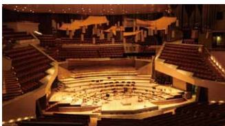
大規模イベント会場での連携

標準価格 128,000円(税抜) 付属品: 設定用リモコン/DC電源ケーブル 取付け金具/Uボルト