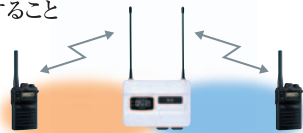
中継器利用で通話エリア拡張

通話エリアを拡大する中継通信用チャンネル全27周波数に対応しています。FTH-208どうしの間に中継器を設置することで、通話できるエリアを飛躍的に広げることができます。利用できる中継器は、トーン信号を内蔵したタイプです。