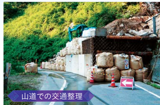
山道での交通整理

通話装置としてではなく、中継装置としても使えます。屋外における広範囲での通話や、見通しの悪い場所での通話をサポートします。